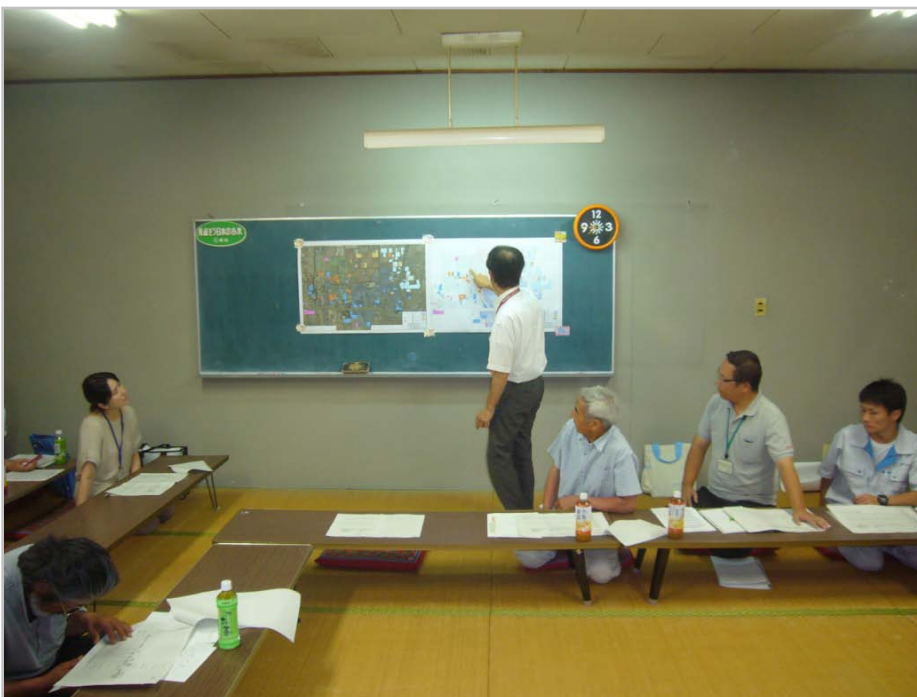
平成24年7月 生産組合長会議で、作成した 農地利用計画図（現況）を使用 して説明

③平成24年5月～：水土里ネット佐賀に、佐賀市から「人・農地プラン」の作成方法について相談があり、7月から農協の支所単位で、図面作成を開始。作成した図面は、「人・農地プラン」における農家との話し合いに活用。