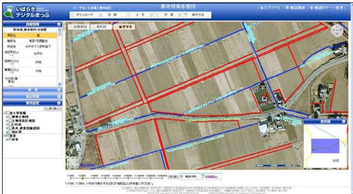
デジタルオルソ画像の上に農業用排水施設図を表示