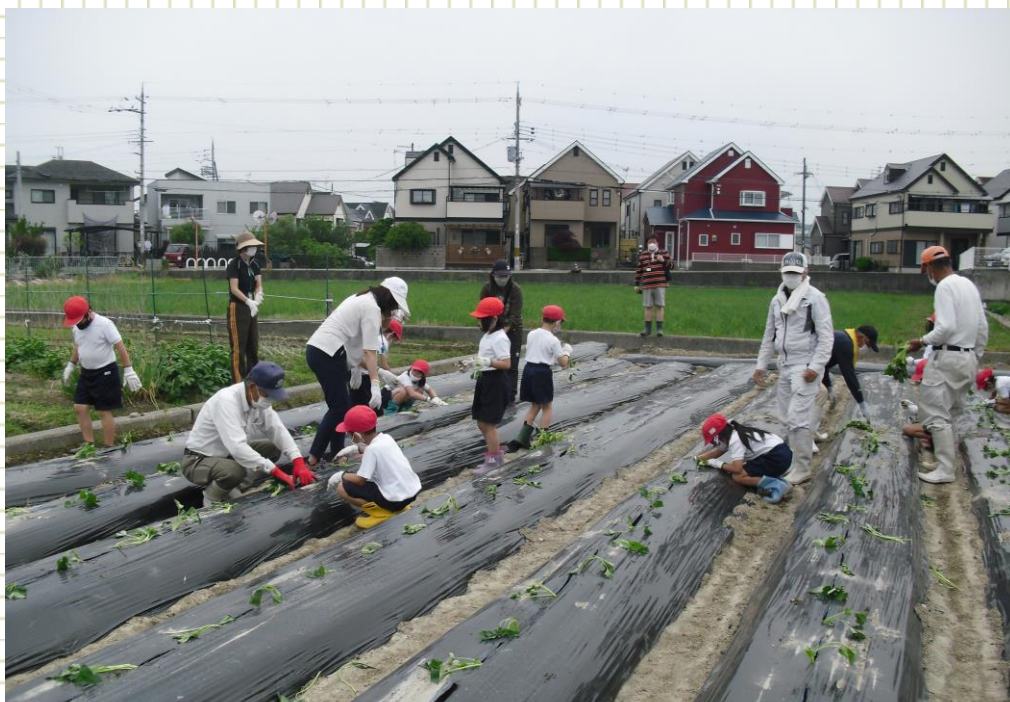
( 泉佐野市上之郷 )