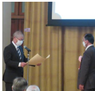
全国土地改良功労者等表彰