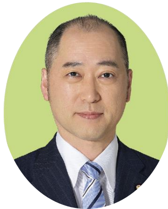
農林水産大臣政務官 参議院議員 宮崎 雅夫