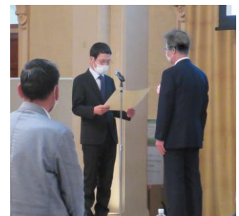
第61回土地改良功労者表彰

研修会では、大阪府環境農林水産部農政室推進課溝淵参事による「おおさか農政アクションプラン」と題し、プランの目的、これまでの成果や将来に向けての取り組みの方向性・施策をご講演いただきました。