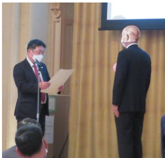
大阪府知事感謝状