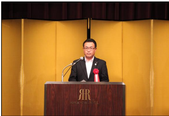
大阪府 竹内廣行 副知事