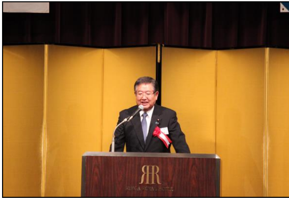
左藤章 衆議院議員