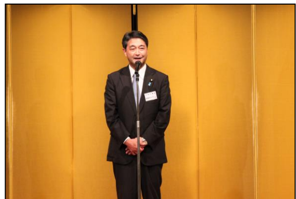
進藤金日子 参議院議員