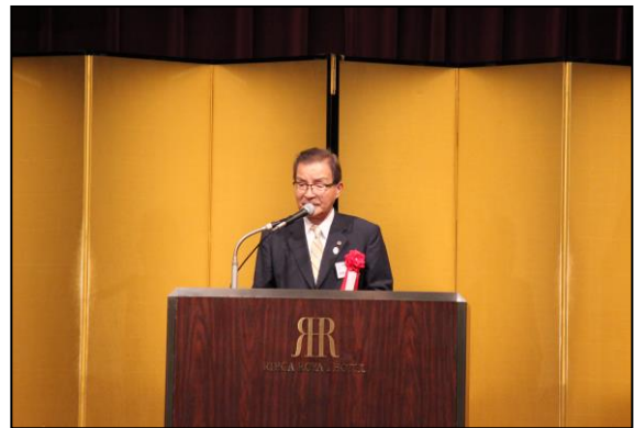
大阪府議会 西野しげる 副議長