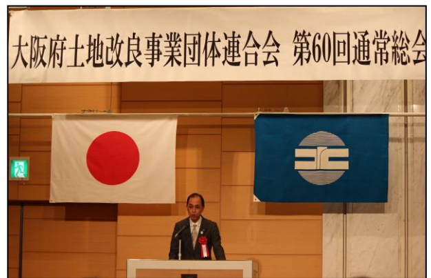
竹柴大阪府環境農林水産部長